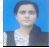
Photo and Signature